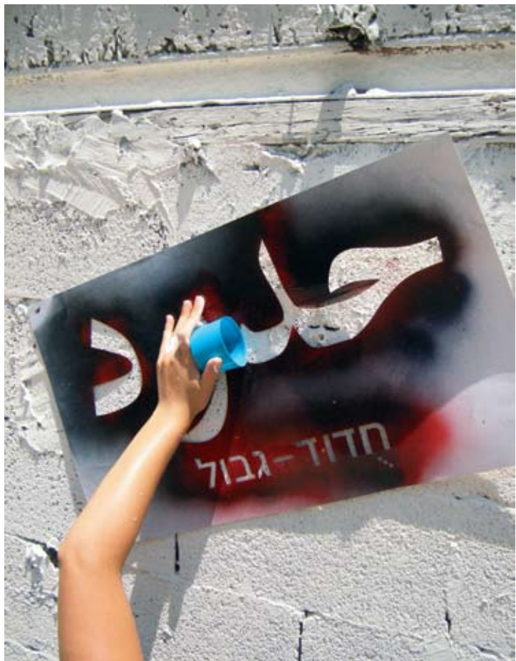
3-2 פרויקט "דרך השפה, יפו", 2008. רעיון ושבלונות: קבוצת פרהסיה, ביצוע גרפיטי: בני נוער מתנועת סדאקה רעות, יפו. מתוך התערוכה והספר תסיסה, אוצרת ועורכת: רונה סלע