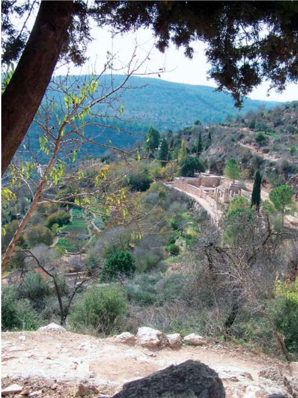
6. שרידי הכפר סטף, מבט כללי, 2005.