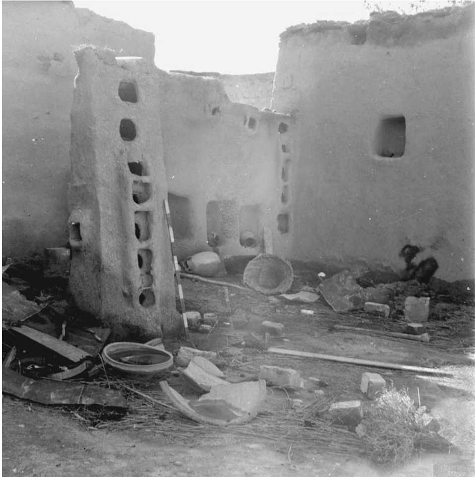
1. הכפר פְּרִתְיָה, נובמבר 1948 לערך. i143