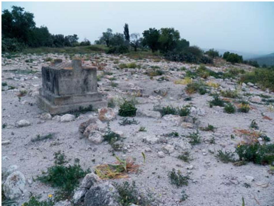
4. שרידי בית הקברות של הכפר לטרון, 2013. בתי הכפר שהיו בשטח ההפקר בין ישראל לירדן נהרסו בשנת 1967.