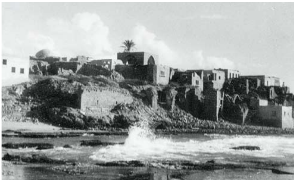
5. הכפר אכזיב בשנות החמישים. לתמונה מזווית דומה מימינו ראו: http://en.wikipedia.org/wiki/File:Zeeb_beach.JPG