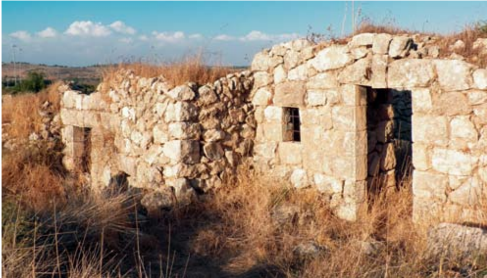
2. שרידים בכפר כוּנִיקָה (כיום "חורבת נכס", ליד אזור התעשייה של מודיעין), 2012. אולי משום שהיה זה "כפר בת" קטנטן, הוא לא נכלל במבצע הרס הכפרים בשנות השישים.